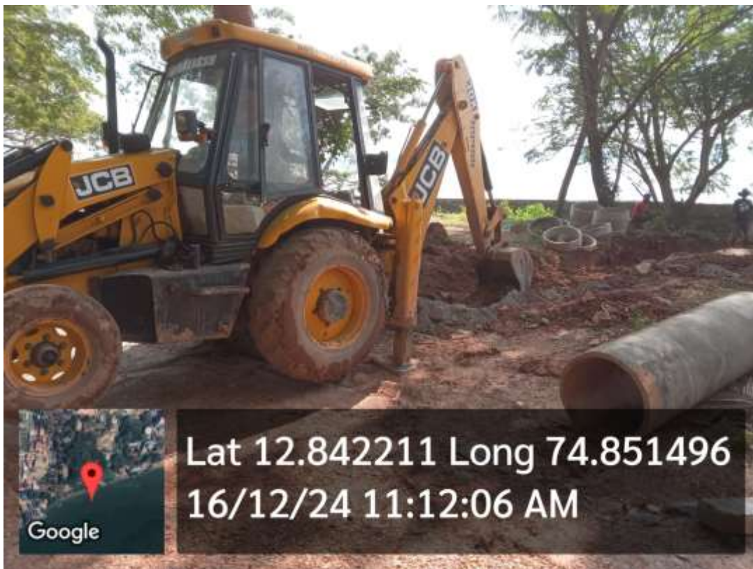
Photograph Depict Bulldozers Near The Sensitive Mangrove Area causing irreversible damage to CRZ area