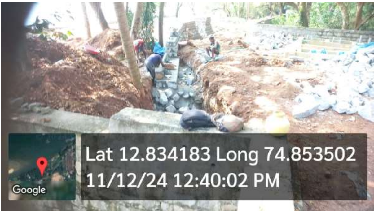
Ongoing CRZ Violations at MSCL Waterfront Project – As of December 11, 2024, NGT Hearing Date